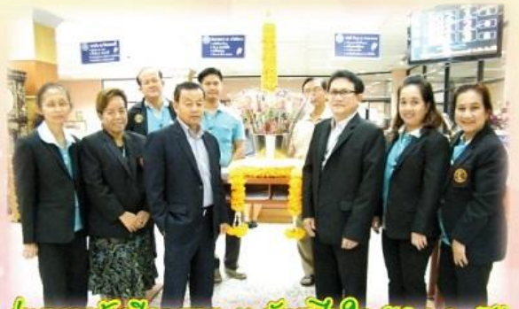
ร่วมถวายต้นไม้ทองพระบาทสมเด็จพระวชิรเกล้าเจ้าอยู่หัว (19 ก.ค. 56)