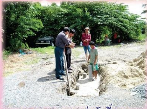
คณะกรรมการตรวจการก่อสร้างที่จอดรถ