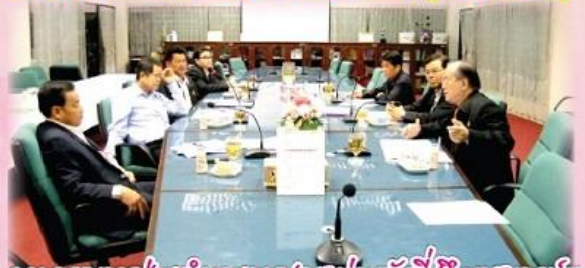
คณะกรรมการฝ่ายอำนวยการประชุมร่วมกับทีมบริหารสหกรณ์ฯ (18 ก.ค. 56)