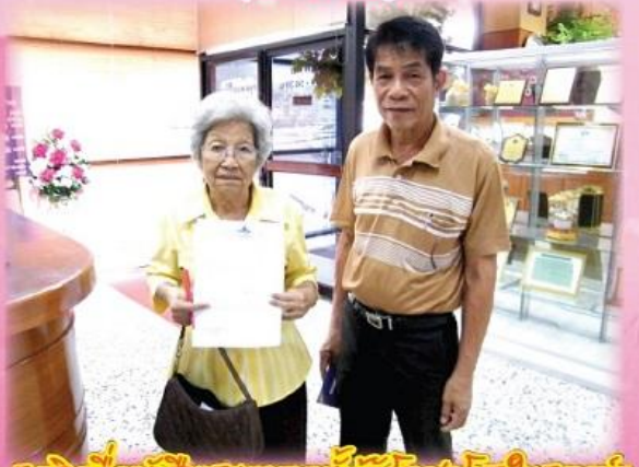
สมาชิกหนึ่งหนังสือแสดงเจตนาตั้งผู้รับโอนทรัพย์สินในสหกรณ์ฯ