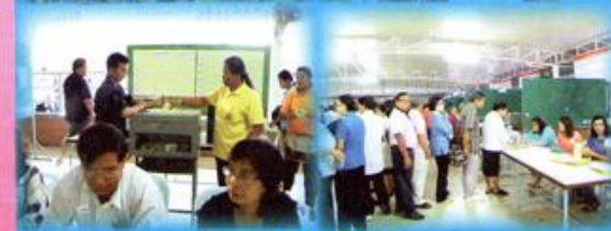
บรรยากาศการเลือกตั้งคณะกรรมการฯ เมื่อวันที่ 22 ธันวาคม 2555