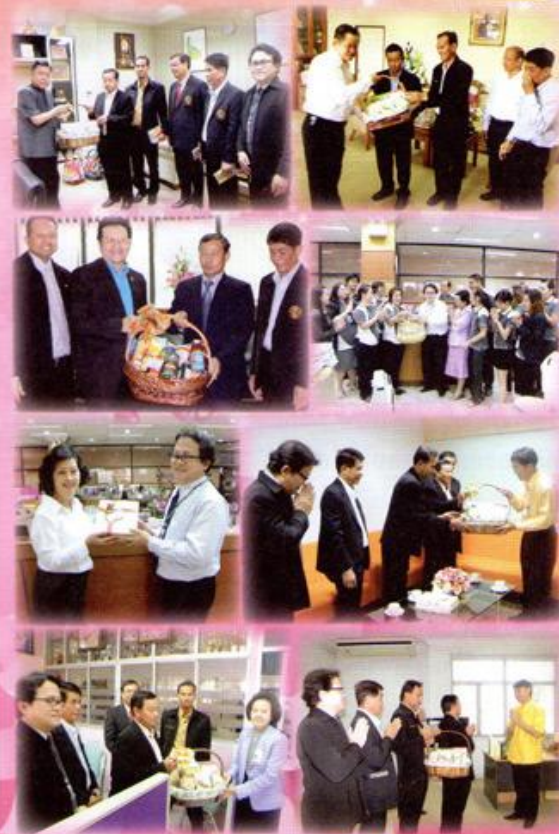
อายุพรช่วงเทศกาลปีใหม่ 2556