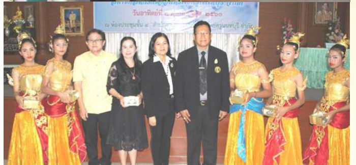
ภาพบรรยากาศการจัดงาน เกษียณมุฑิตาจิตสมาชิกประจำปี 2560

แม่ .. วันเวลาหมุนเวียนเปลี่ยนวัย แต่ .. ใจกายขอให้สดใสแข็งแรง ด้วยรักจริง .. จากใจชาวสหกรณ์ออมทรัพย์คุณนทบุรี จำกัด