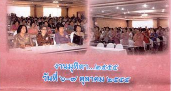
งานมุทิตา...๒๕๕๕ วันที่ ๖-๗ ตุลาคม ๒๕๕๕