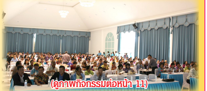
(ดูภาพกิจกรรมต่อหน้า 11)