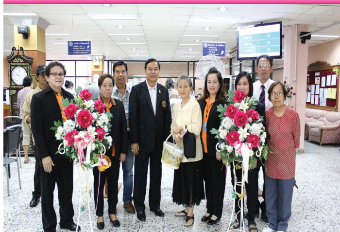
เปิดโครงการออมทรัพย์รับดอกเบี๋ยสูง โครงการ 5 (“ทวีทรัพย์ 1 โครงการ 5”) เริ่ม 1 กรกฎาคม - 31 สิงหาคม 2558

โครงการพัฒนาข้าราชการครู และสมาชิกสหกรณ์ฯ การเตรียมความพร้อมเพื่อรองรับการประเมินคุณภาพภายนอก รอบสี่ ณ สหกรณ์ออมทรัพย์ครูนนทบุรี จำกัด