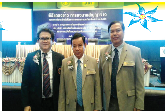
การลงนามสัญญาจ้างระหว่างบริษัทเมโทรซิสเต็ม คอร์ปอเรชั่น จำกัด (มหาชน) กับ ชสอ. พร้อมทำMOUกับ สหกรณ์นำร่องระบบงานสหกรณ์ออมทรัพย์