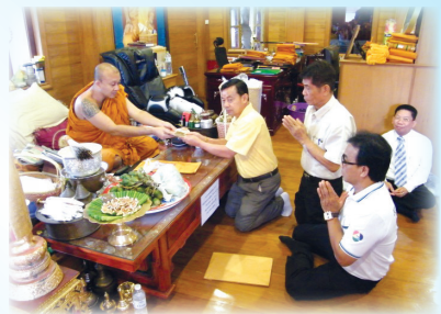
หลวงพ่อชำนาญ วัดบางกุฎีทอง