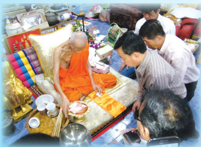
หลวงพ่อรวย วัดตะโก

โครงการเฉลิมฉลองสหกรณ์ฯครบรอบ 55 ปี ในปีพ.ศ. 2558 นี้ (สหกรณ์ฯตั้งขึ้นเมื่อพ.ศ. 2503) โดยมีกิจกรรมสำคัญ 3 ประการ คือ ทำบุญใหญ่ที่สหกรณ์ฯในเดือนเมษายน 2558 จัดสร้างวัดอุ้มงคลเพื่อมอบให้แก่สมาชิกสหกรณ์ฯทุกคน และสุดท้ายคือการเป็นเจ้าภาพทอดกฐิน การจัดสร้างวัดอุ้มงคลหลวงปู่เอี่ยมวัดสะพานสูง และหลวงปู่ทวด วัดช้างให้ ขณะนี้พระเกจิอาจารย์จำนวน 5 รูป ได้จารลงอักขระในแผ่นเงิน แผ่นทองแล้ว รายชื่อพระเกจิอาจารย์ ได้แก่ หลวงพ่อรวย วัดตะโก หลวงพ่อเพิ่ม วัดป้อมแก้ว หลวงพ่อพูน วัดบ้านแพน ทั้ง 3 รูป อยู่ในจังหวัดพระนครศรีอยุธยา รูปที่ 4 คือ หลวงพ่อชำนาญ วัดบางกุฎีทอง จังหวัดปทุมธานี และรูปที่ 5 หลวงพ่อมาลัย วัดบางหญ้าแพรก จังหวัดสมุทรสาคร (รายชื่อเพิ่ม พูน ชำนาญ มาลัย) สมาชิกท่านใดที่สนใจสอบถามรายละเอียดได้ที่สำนักงานสหกรณ์ฯ โทร.02-969-8201-2