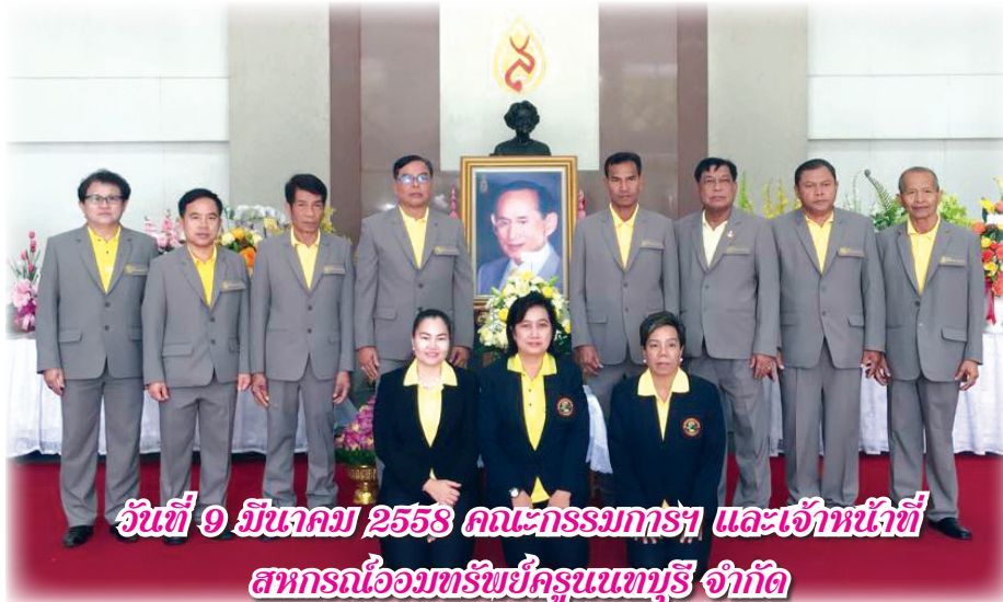
วันที่ 9 มีนาคม 2558 คณะกรรมการฯ และเจ้าหน้าที่ สหกรณ์ออมทรัพย์นครนันทบุรี จำกัด

ร่วมลงนามถวายพระพร พระบาทสมเด็จพระเจ้าอยู่หัว